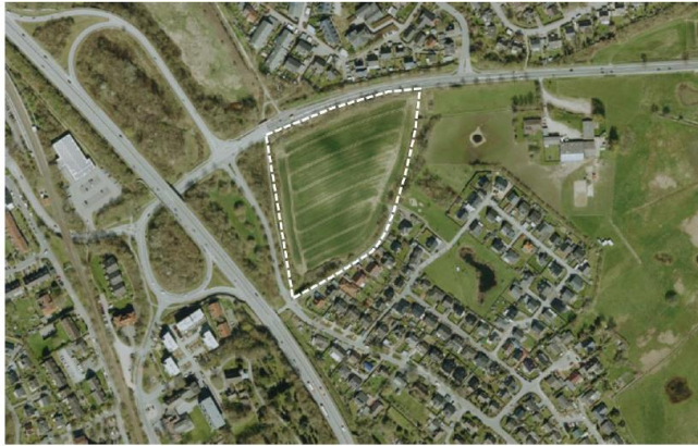
Digitaler Atlas Nord

Zur Einleitung des Verfahrens zur Änderung des Flächennutzungsplanes wird verwaltungsseitig vorgeschlagen, den Aufstellungsbeschluss zu fassen sowie die frühzeitigen Beteiligungsverfahren gemäß § 3 Abs. 1 BauGB und § 4 Abs. 1 BauGB durchzuführen. Im weiteren Verfahren wird das Verfahren zur 35. Änderung des Flächennutzungsplanes der ehemaligen Gemeinde Raisdorf möglicherweise umbenannt in ein Verfahren zur Änderung des Flächennutzungsplanes der Stadt Schwentinental.