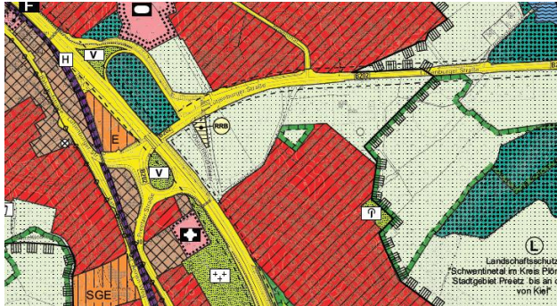
Auszug Planzeichnung F-Plan Neuaufrstellung

Das Entwicklungsgebiet ist im Flächennutzungsplan der Stadt Schwentinental als Fläche für die Landwirtschaft dargestellt. Das Verfahren zur Neuaufrstellung des Flächennutzungsplanes für die Stadt Schwentinental liegt derzeit dem Ministerium für Inneres, Kommunales, Wohnen und Sport als oberste Landesbehörde zur Genehmigung vor.