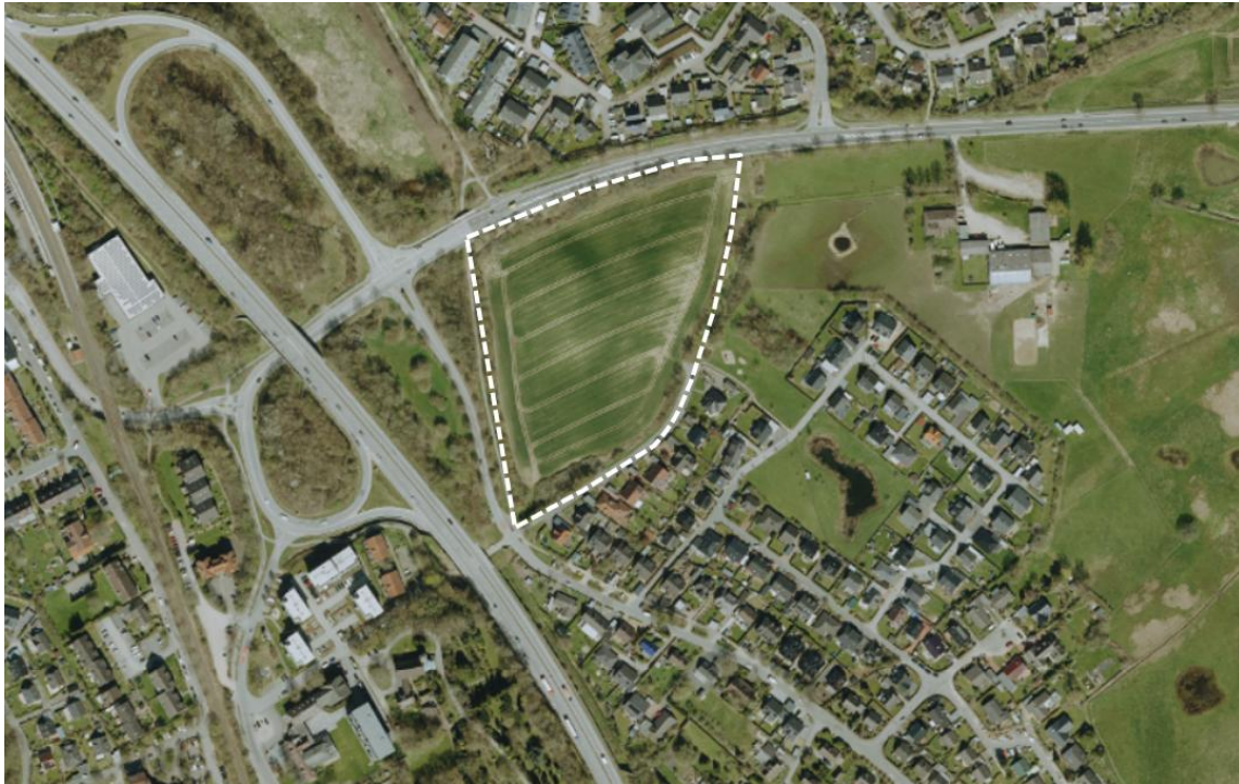
Abb.: DA Nord