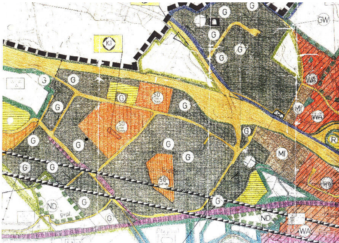
Abb. 1: geltender FNP der Gemeinde Raisdorf

Die vorzeitige Aufstellung ist möglich, wenn bei Gebiets- oder Bestandsänderungen von Gemeinden ein Flächennutzungsplan fort gilt. Die Stadt folgt dem Verfahren des § 8 Abs. 4 BauGB, da die Aufstellung der Bebauungspläne zur Steuerung und Ordnung der diffusen Einzelhandelsentwicklung im Ostseepark dringend und zeitnah erforderlich ist. Die Festsetzungen stehen dabei weder der städtebaulichen Entwicklung noch den Zielen der Stadt Schwentimental entgegen. Zudem ist eine separate Betrachtung der Planung des Ostseeparks unabhängig von den Siedlungsbereichen in Klausdorf und Raisdorf möglich. Die erforderlichen Detaillösungen der Bebauungspläne lassen sich in einem „reinen FNP-Neuaufstellungsverfahren“ nicht in der notwendigen Dichte darstellen. Es ist deshalb davon auszugehen, dass die Darstellungen des in Aufstellung befindlichen Flächennutzungsplanes in Einklang mit den Festsetzungen der Bebauungspläne stehen werden.